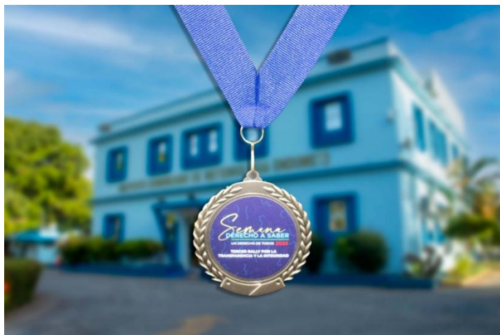
Semana del Derecho a Saber 2025 , participando en el "Rally por la Transparencia e Integridad"