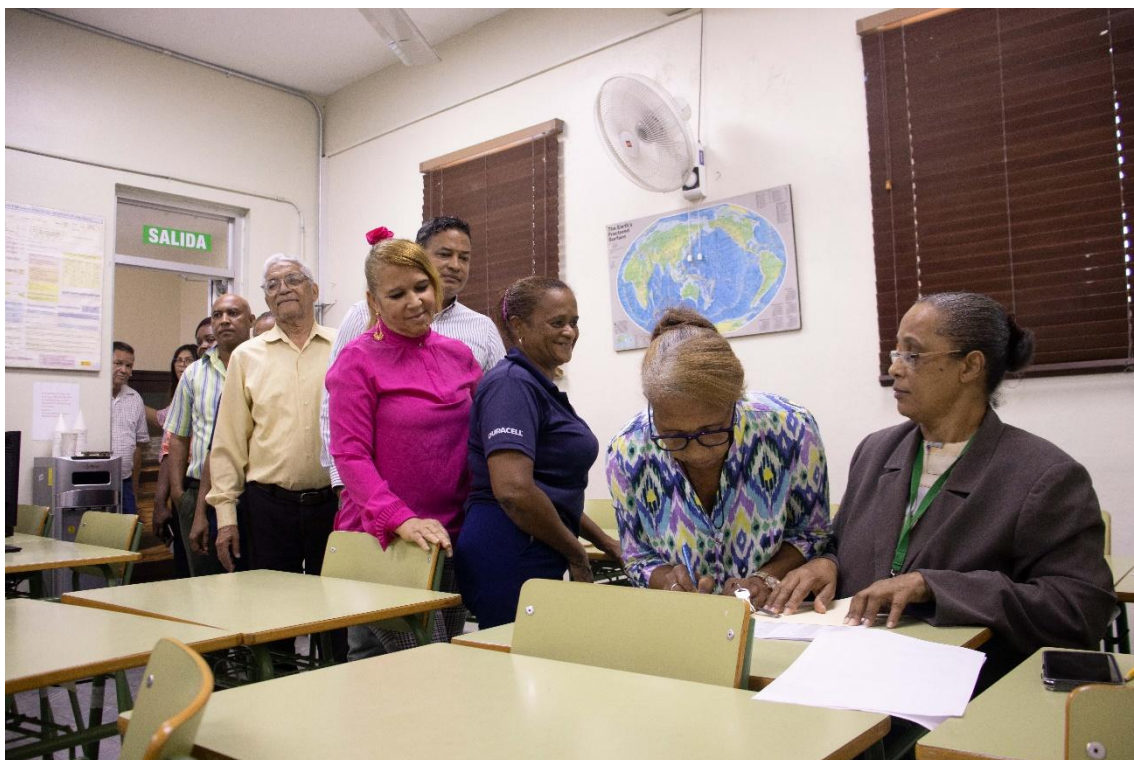
Proceso de votación llevado a cabo en la sede central del INDOMET.

por el órgano rector, realizado mediante la modalidad “votación digital”, donde las mismas fueron llevadas a cabo con éxito.